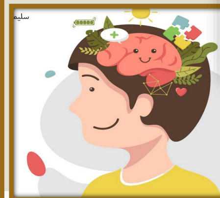
۳. برخورداری از علاقه اجتماع